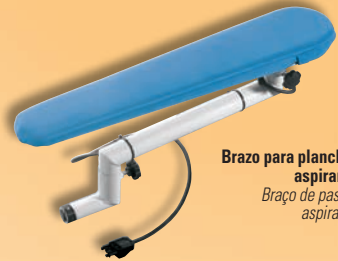
Brazo para planchar aspirante Braço de passar aspirante