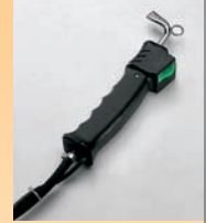
Pistola vapor - Pistola vapor