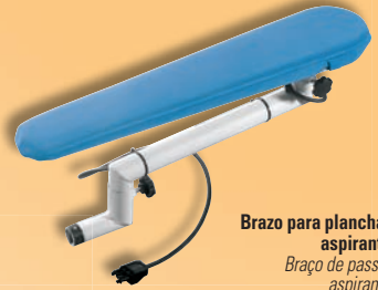
Brazo para planchar aspirante Braço de passar aspirante